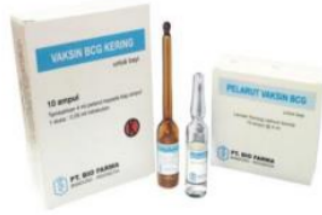
Gambar 1 Vaksin BCG

dan lebih dari 12 bulan atau 20 dosis (1 dosis = 0,05 ml) untuk bayi dan anak-anak usia dibawah 12 bulan. Vaksin yang sudah dilarutkan harus dibuang setelah 4-6 jam.