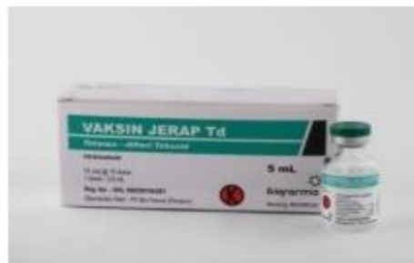
Gambar 2 Vaksin Td

Vaksin ini merupakan suspensi untuk injeksi.