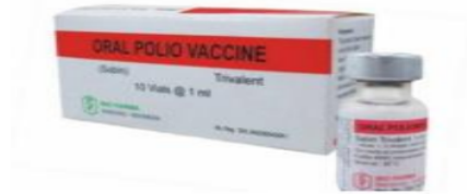
Gambar 5 Vaksin Polio

Kegunaan : Vaksin polio digunakan untuk memberikan kekebalan aktif terhadap poliomyelitis.