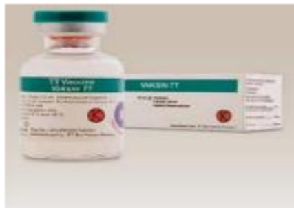
Gambar 3 Vaksin TT