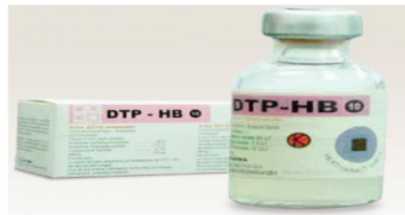
Gambar 8 Vaksin DPT

Kegunaan : Vaksin DPT-HB digunakan untuk memberikan kekebalan aktif terhadap penyakit difteri, tetanus, pertusis dan Hepatitis B. Warna vaksin putih keruh seperti vaksin DPT .