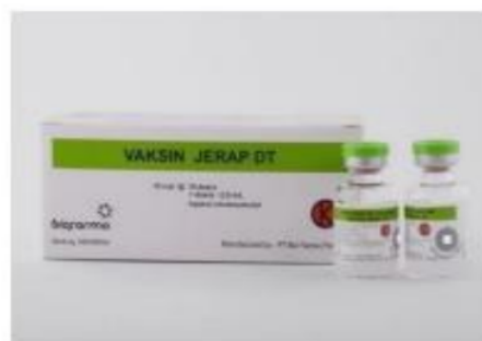
Gambar 4 Vaksin DT

Vaksin DT berbentuk cairan dengan setiap vial berisi 10 dosis.