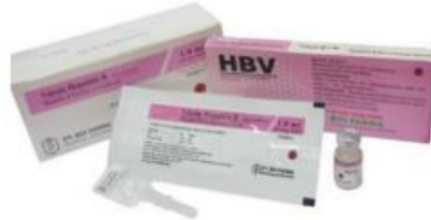
Gambar 7 Vaksin Hepatitis B

Kegunaan : Vaksin Hepatitis B digunakan untuk memberikan kekebalan aktif terhadap infeksi yang disebabkan oleh virus Hepatitis B, tapi tidak dapat mencegah infeksi virus lain seperti virus Hepatitis A atau C yang diketahui dapat menginfeksi hati.