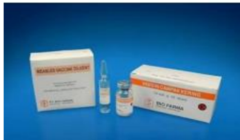
Gambar 6 Vaksin Campak

Vaksin berbentuk beku kering dengan setiap vial berisi 10 dosis.