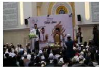
Pengurus masjid Ulul Azmi mengadakan Tabligh Akbar mengundang Ustadz Abdul Somad