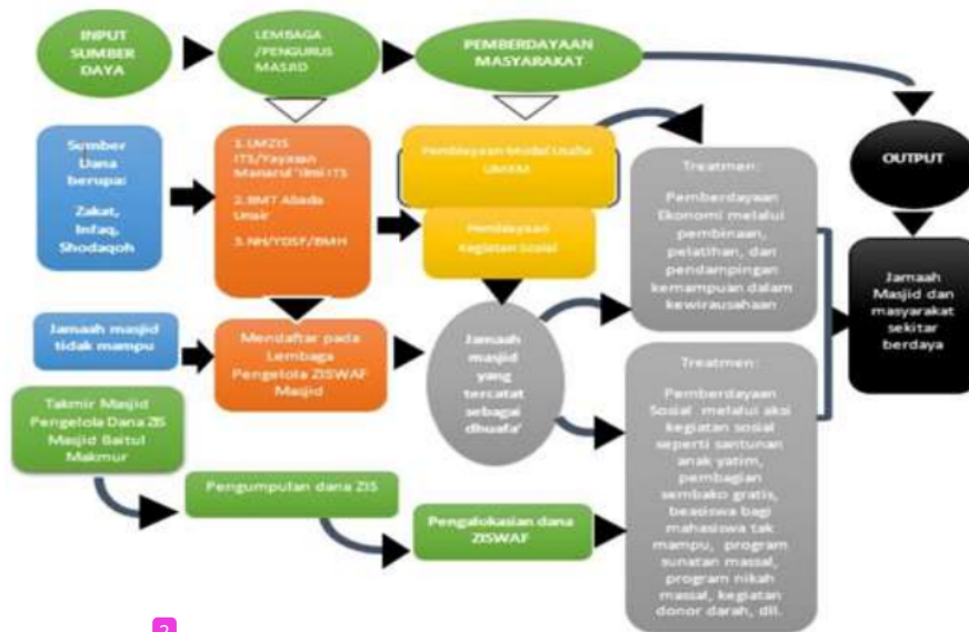
2 Gambar 3. Model Pemberdayaan Ekonomi-Sosial Masyarakat Berbasis Masjid Kampus.