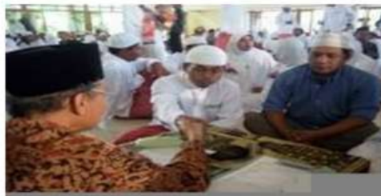
Acara nikah massal yang diselenggarakan oleh pengurus masjid Manarul 11mi ITS bekerjasama dengan lembaga zakat BMH.