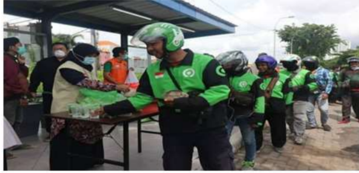
Pembagian paket makanan untuk para pengemudi ojek online oleh YMI-ITS