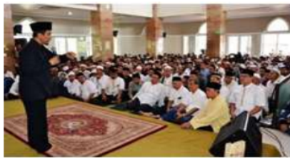
Mahasiswa sastra Unair bekerjasama dengan pengurus Masjid Ulul Azmi mengadakan Tabligh Akbar mengundang Ustadz Yusuf Mansyur