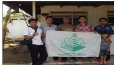
Santunan anak yatim oleh BKLDK ITS Kegiatan Musabaqah Tilawatil Qur'an