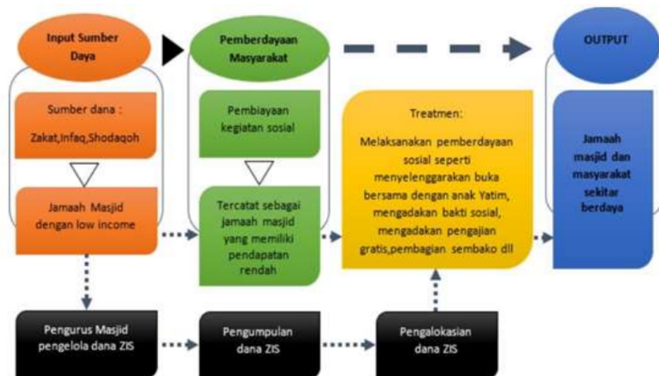
Gambar 2. Proses Pemberdayaan Ekonomi-Sosial Masyarakat Berbasis Masjid Baitul Makmur-Unesa.