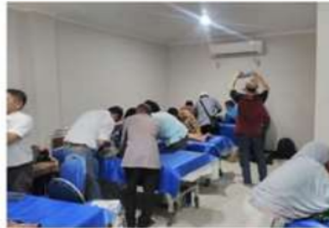
Foto tampak depan masjid Ulul Azmi Kegiatan sunatan massal gratis yang kampus C Unair diselenggarakan oleh alumni FE Unair dengan pengurus masjid Ulul Azmi Unair