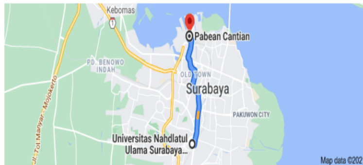
Gambar 1 Peta Lokasi Kegiatan Pengabdian Kepada Masyarakat

Masalah mutu layanan pada masyarakat Kelurahan Bongkaran, Kec Pabean Cantikan, Surabaya salah satunya adalah kurangnya informasi mengenai imunisasi untuk mencegah Covid-19.