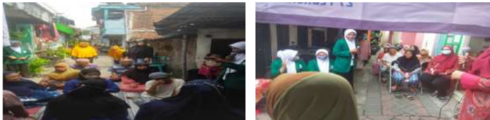
Gambar 2. Pelaksanaan pemberian edukasi kepada masyarakat

Program yang juga penting dalam pengabdian kepada masyarakat ini adalah pemberian pendidikan kesehatan tentang mencegah penularan HIV/AIDS dengan A, B, C, D, dan E secara bertahap karena tempat yang kurang memadai.