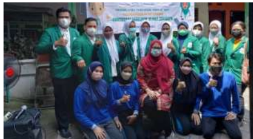
Gambar 1. Survey dan observasi kelompok sasaran

Tim mendatangi lokasi pengabdian kepada masyarakat yang sudah memenuhi kriteria yaitu lingkungan sekitar yang terdapat kasus HIV/AIDS, kemudian melakukan wawancara dan observasi.