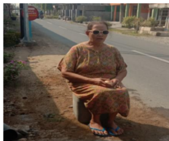
Gambar 4. Pelaksanaan terapi berjemur dipagi hari selama 10 menit