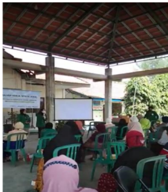
Gambar 2. Pelaksanaan kegiatan penyuluhan terapi berjemur di pagi hari dan diet sehat guna pencegahan Diabetes Melitus