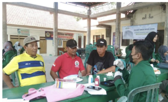
Gambar 3. Pelaksanaan kegiatan pemeriksaan kadar Glukosa Darah