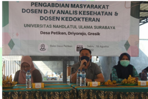
Gambar. 3 Sosialisasi Manfaat pisang

Sosialisasi dilakukan pada masyarakat Desa Petiken didapatkan manfaat yang dengan menambah pengetahuan dengan meningkatnya pengetahuan masyarakat tentang pentingnya konsumsi buah pisang yang kaya akan manfaat yang tinggi untuk meningkatkan derajat Kesehatan masyarakat