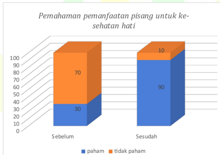
Gambar .1 Pemahaman pemanfaatan pisang

Berdasarkan hasil tingkat pemahaman didapatkan hasil bahwa sebelum dilakukan sosialisasi dilakukan pengukuran pemahaman pada masyarakat untuk pengukuran pemahaman pisang sebagai manfaat untuk kesehatan hati didapatkan bahwa pada sebelum didapatkan 70% masyarakat tidak paham tentang manfaat pisang sebagai Kesehatan hati dan 30% masyarakat paham terhadap masyarakat, selanjutnya setelah sosialisasi dilakukan didapatkan bahwa terjadi peningkatan yang signifikan sebesar 60% yaitu dari 30% ke 90% berdasarkan tingkat pemahaman.