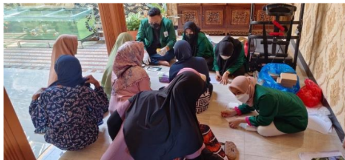
Gambar 3.4 Pemeriksaan Urine

Gula darah tinggi terus-menerus Kerusakan bisa terjadi secara terus menerus dinding pembuluh darah dimana kerusakan pada dinding pembuluh darah itu bisa menyebabkannya albumin dalam urin. Menghindari adanya mikroalbuminuria, terpengaruh DM harus menerapkan gaya hidup lebih dari sehat makan buah-buahan dan sayur-sayuran, kurangi konsumsi gula dan makanan manis, diet tinggi protein, tidak merokok dengan mengurangi jumlah yang dikonsumsi makanan yang mengandung garam olahan juga melakukan pemeriksaan mikroalbuminuria rutin Periksa kadar albumin dalam urin.