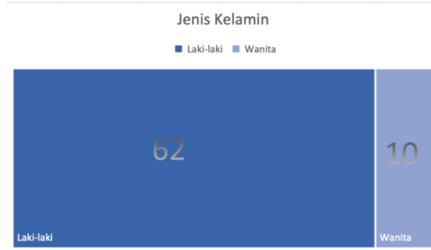
Gambar 3.1 Jenis Kelamin

Berdasarkan hasil tingkat pemahaman didapatkan hasil bahwa sebelum dilakukan sosialisasi dilakukan pengukuran pemahaman pada masyarakat untuk pengukuran pemahaman pisang sebagai manfaat untuk kesehatan hati didapatkan bahwa pada sebelum didapatkan 50% masyarakat tidak paham tentang manfaat deteksi urine sebagai kesehatan ginjal dan 50% masyarakat paham terhadap masyarakat, selanjutnya setelah sosialisasi dilakukan didapatkan bahwa terjadi peningkatan yang signifikan sebesar 40% yaitu dari 50% ke 90% berdasarkan tingkat pemahaman.