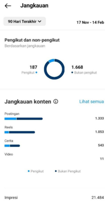
Gambar 6. Nilai jangkauan secara keseluruhan

Dapat dilihat dari gambar diatas bahwa akun instagram @klinikpratamauiinsa memdapatkan reach atau jangkauan dalam waktu 90 hari terakhir paling tinggi mencapai 398 akun pada satu kali post di feed, sedangkan reach pada story mencapai 161 akun pada kurun waktu 24 jam, dan diperoleh reach secara keseluruhan sebesar 1.855 dengan total reach followers 187 jangkauan dan non followers 1.668 jangkauan, akun non followers dapat berinteraksi dari feed yang diunggah karena ada beberapa hal yang mempengaruhinya antara lain; akun yang bersifat public dan penggunaan hastag-hastag tertentu (Nurliya,2021). Dengan nilai reach non followers yang tinggi maka dapat disimpulkan akun instagram @klinikpratamauiinsa berpeluang mendapatkan lebih banyak followers.