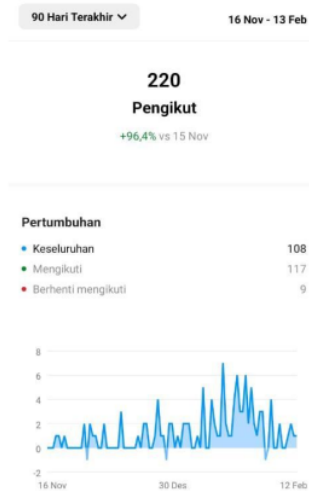
Gambar 2. Diagram jumlah followers

16 kegiatan klinik Pratama UINSA, adapun kenaikan dan penurunan jumlah followersnya dapat dilihat dari Diagram berikut ini :