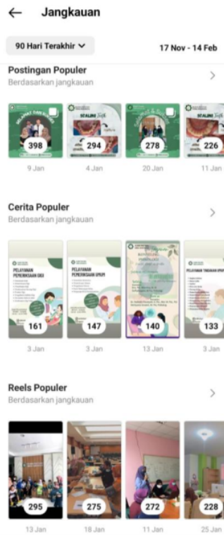
Gambar 5. nilai jangkauan per konten