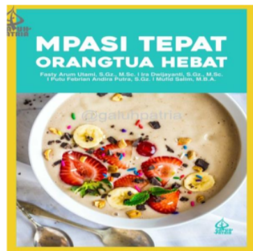
Gambar. 3 Buku MPASI yang dibagikan kepada sasaran edukasi

Materi edukasi berasal dari buku monograf dengan judul ‘MPASI Tepat Orang Tua Hebat’ (Gambar.3). Buku ini merupakan luaran kegiatan pengabdian kepada masyarakat sebelumnya yang berjudul ‘Empowering Quality of –Web-based Nutrition and Health Education Through Knowledge Upgrading for Startup in Yogyakarta’. Hasil kolaborasi antara tim pengabdian kepada masyarakat dan platform edukasi gizi diaplikasikan untuk mendukung kegiatan edukasi ini.