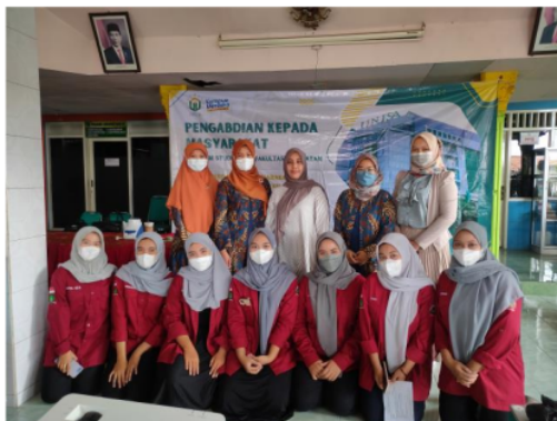
Gambar.4 Dokumentasi kegiatan edukasi PMBA

posyandu Desa Masangan Kulon. Para kader sangat antusias dan turut serta membantu kegiatan ini agar berjalan dengan lancar dan optimal (Gambar.4). Koordinasi antara tim pengabdian kepada masyarakat, kader posyandu dan perangkat desa dilakukan melalui diskusi bersama dan dilanjutkan melalui aplikasi whatsapp. Proses komunikasi berlangsung secara optimal dan sesuai dengan rencana yang telah disepakati di awal diskusi.