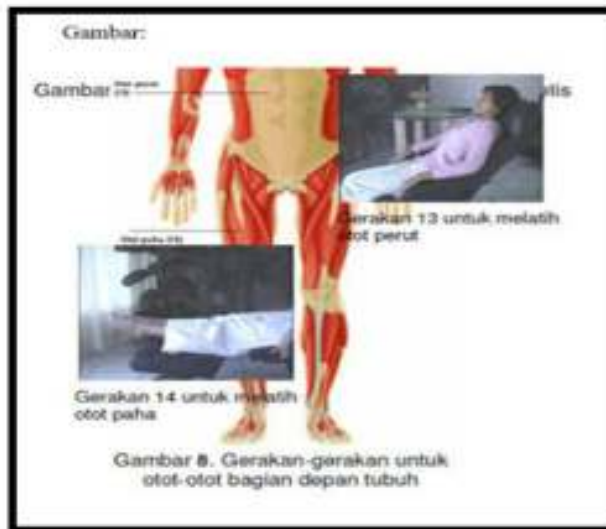
Gambar 3.5 Gerakan 13-14 Islamic Progressive Muscle Relaxation