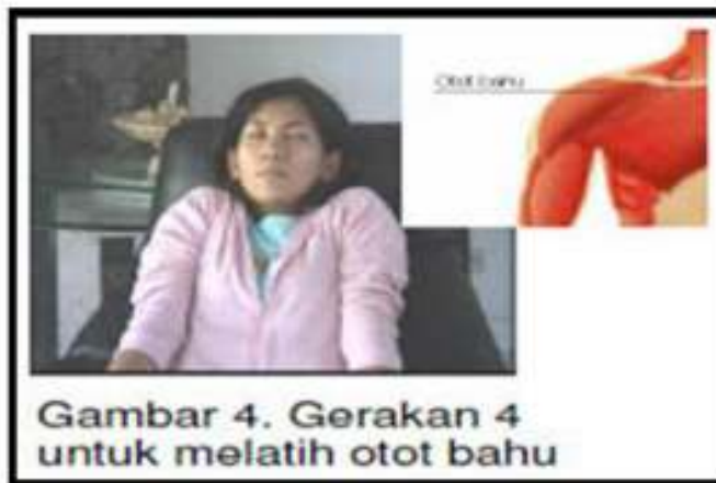
Gambar 3.3 Gerakan 4 Islamic Progressive Muscle Relaxation