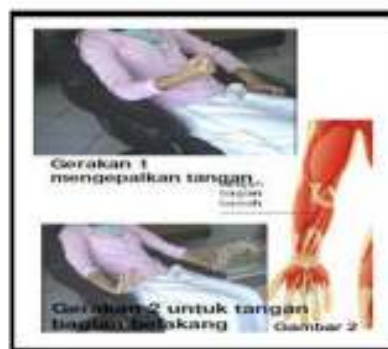
Gambar 3.1 Gerakan 1 dan 2 Islamic Progressive Muscle Relaxation