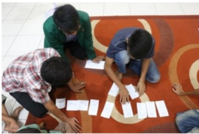
Gambar 5. Permainan edukasi bertema spritualitas