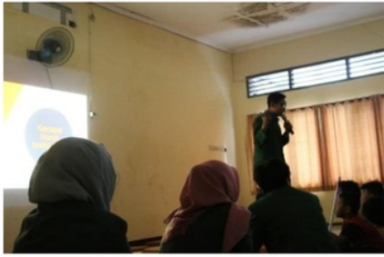
Gambar 4. Pembelajaran anak negeri bertema spritualitas