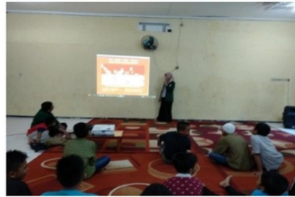
Gambar 2. Pembelajaran anak negeri bertema nasionalisme

Dari tabel dan grafik diatas dapat diketahui bahwa setelah peserta didik mengikuti serangkaian program “Pembelajaran Anak Negeri” yang dilakukan dengan pemberian materi tentang kreativitas, nasionalisme dan spiritualitas diikuti dengan permainan edukasi oleh tim FK UNUSA, nasionalisme dan spiritualitas peserta program meningkat, sedangkan radikalisme menurun.