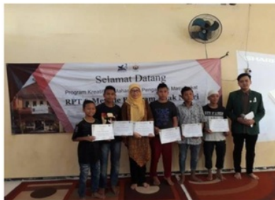
Gambar 6. Pembentukan kader "anak negeri"