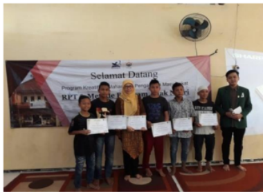
Gambar 6. Pembentukan kader "anak negeri"