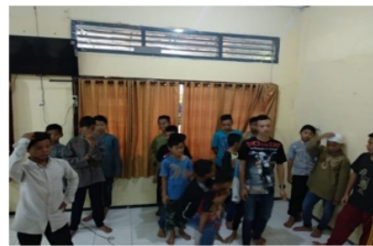
Gambar 3. Permainan edukasi bertema nasionalisme