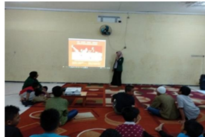
Gambar 2. Pembelajaran anak negeri bertema nasionalisme

Dari tabel dan grafik diatas dapat diketahui bahwa setelah peserta didik mengikuti serangkaian program “Pembelajaran Anak Negeri” yang dilakukan dengan pemberian materi tentang kreativitas, nasionalisme dan spiritualitas diikuti dengan permainan edukasi oleh tim FK UNUSA, nasionalisme dan spiritualitas peserta program meningkat, sedangkan radikalisme menurun.