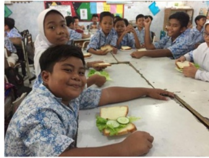
Gambar 3. Siswa dalam mengikuti pelatihan pembuatan bekal sehat

pembuatan bekal sehat yang mudah dan menarik dapat menstimulasi siswa dalam meningkatkan sikap atau kesadaran siswa, sehingga perilakunya bisa berubah.