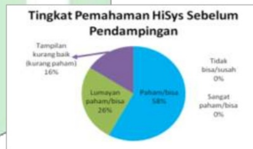
Gambar 3 Tingkat Pemahaman Pegawai Sebelum Pendampingan

Pendidikan terakhir berdasarkan Gambar 2 dapat diketahui bahwa pendidikan terakhir responden paling banyak adalah Sekolah Menengah Kejuruan (SMK) Farmasi, disusul kemudian diploma tiga (D3) farmasi dan terakhir sarjana strata satu (S1) farmasi. Pegawai yang berpendidikan SMK sebanyak 68,42% atau 13 orang, D3 sebanyak 21,05% atau 4 orang dan S1 sebanyak 10,53% atau 2 orang. Apabila dihubungkan dengan kedudukan pegawai (jabatan) dengan pendidikan terakhir maka diperoleh informasi bahwa pegawai yang memiliki pendidikan S1 memiliki kedudukan sebagai kepala farmasi dan kepala logistik farmasi. Sedangkan yang memiliki pendidikan terakhir D3 dan SMK memiliki kedudukan sebagai staff.