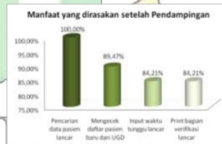
Gambar 6 Manfaat yang dirasakan Pegawai setelah Pendampingan

selama penggunaan HiSys , seperti yang digambarkan pada sebelum pendampingan. Dengan adanya pendampingan kesulitan cepat diatasi dan dilaporkan kepada pembuat HiSys . Manfaat pertama adanya pendampingan adalah proses pencarian data pasien yang cepat. Proses pendampingan juga membantu pegawai dalam hal pengecekan nama pasien baru yang ada di UGD, sehingga bagian farmasi lebih cepat memproses pembelian obat dari pasien UGD. Selain itu pendampingan juga membantu inputan waktu tunggu pada unit farmasi, sehingga tidak ada resep menumpuk lagi. Manfaat lain yang dirasakan adalah print data pada verifikasi lancer. Hal ini dikarenakan pegawai juga dibantu dalam penginputan data hingga terekam dan dapat dicetak di bagian verifikasi.