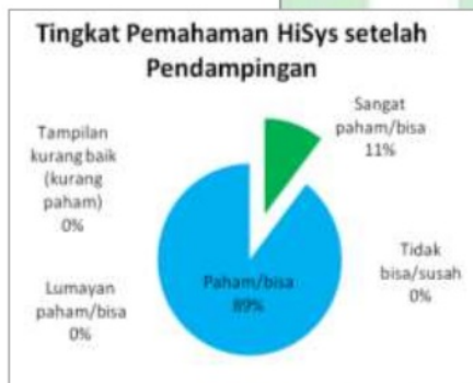
Gambar 5 Tingkat Pemahaman Pegawai Setelah Pendampingan

Pendampingan HiSys kepada pegawai farmasi RSI Surabaya disambut baik. Bahkan ada peningkatan pemahaman pada pegawai farmasi seperti pada Gambar 5. Berdasarkan Gambar 5 sebanyak 17 orang (89%) sudah paham dalam menggunakan HiSys , bahkan 2 orang (11%) sudah sangat paham. Selain peningkatan pemahaman penggunaan HiSys ada beberapa manfaat yang dirasakan oleh pegawai setelah adanya pendampingan.