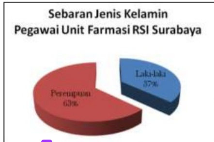
Gambar 1 Persentase Responden berdasarkan Jenis Kelamin

responden terkait pemahaman HiSys sebelum dan setelah pendampingan.