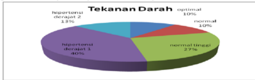
Gambar 1 Hasil Pemeriksaan Tekanan Darah Di RW 06 Karah Jambangan Surabaya

Diabetes Mellitus dan hipertensi, dihadiri 40 orang (terlampir). Dari hasil pemeriksaan tekanan darah yang menunjukkan tekanan darah optimal sejumlah 4 orang (10%), normal 4 orang (10%), normal tinggi 11 orang (27,55), hipertensi derajat 1 16 orang (40%) serta hipertensi derajat 2 sejumlah 5 orang (12,5%).