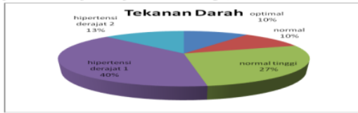
Gambar 1 Hasil Pemeriksaan Tekanan Darah Di RW 06 Karah Jambangan Surabaya

Diabetes Mellitus dan hipertensi, dihadiri 40 orang (terlampir). Dari hasil pemeriksaan tekanan darah yang menunjukkan tekanan darah optimal sejumlah 4 orang (10%), normal 4 orang (10%), normal tinggi 11 orang (27,55), hipertensi derajat 1 16 orang (40%) serta hipertensi derajat 2 sejumlah 5 orang (12,5%).