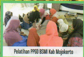
Pelatihan PPGD BSMI Kab Mojokerto