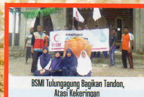
BSMI Tulungagung Bagikan Tandon, Atasi Kekeringan