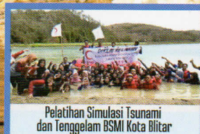
Pelatihan Simulasi Tsunami dan Tenggelam BSMI Kota Blitar