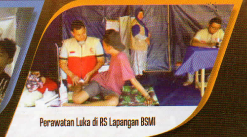
Perawatan Luka di RS Lapangan BSMI