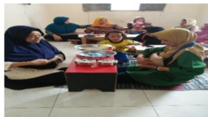
Gambar 6. Pelaksanaan PKM pelatihan dan seminar