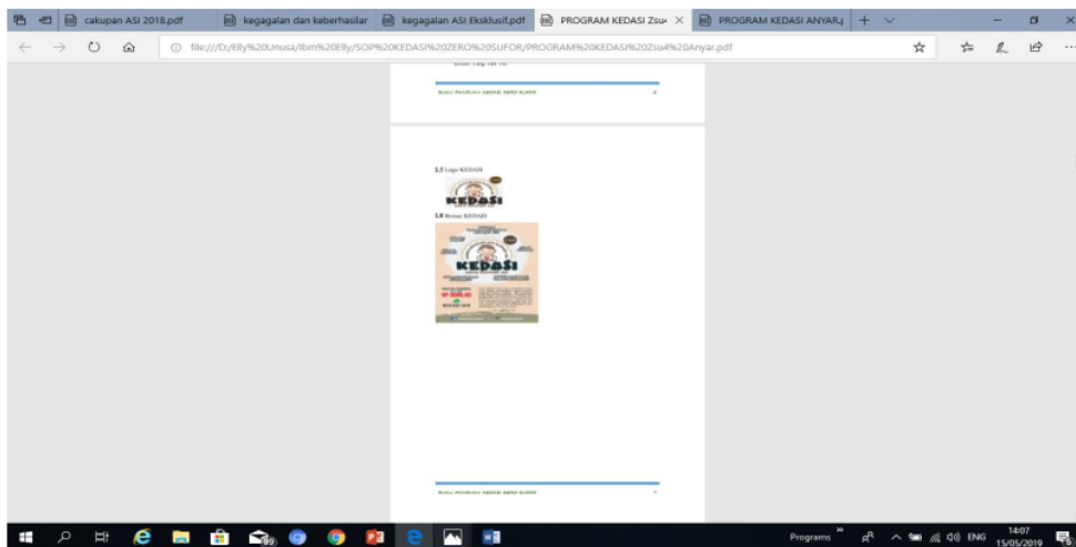
Gambar 4. Logo dan brosur KEDASI