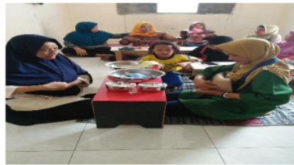
Gambar 6. Pelaksanaan PKM pelatihan dan seminar