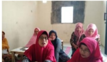
Gambar 1 Pengumpulan data dengan para kader balita dan hamil

Kegiatan ini merupakan kegiatan awal yang bertujuan untuk memperoleh data jumlah pencapaian ASI eksklusif yang dilakukan pada bulan Maret 2018, dikelurahan Wonokromo. Data diambil melalui data ASI yang dikelola oleh kader balita dan kader ibu hamil . Setelah data terkumpul kemudian menganalisis faktor penyebabnya