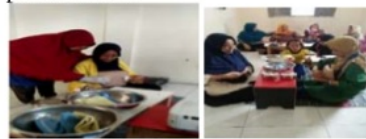
Gambar 4 Pelatihan Perawatan payudara

Pelatihan Perawatan payudara merupakan rangkaian pelatihan KEDASI yang bertujuan untuk memberikan ketrampilan pada pengelola KEDASI dalam mempersiapkan payudara ibu untuk proses laktasi