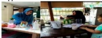
Gambar 8 pelatihan pembuatan makanan dan minuman support ASI