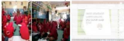
Gambar 2 Sosialisasi KEDASI

Sosialisasi ini bertujuan untuk menyampaikan program KEDASI pad kader, tokoh masyarakat ( RT, RW, Kelurahan )