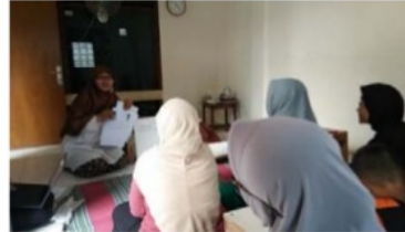
Gambar 3 Pelatihan Konseling ASI

antara lain sehat fisik, psikologi, mampu berkomunikasi dan memiliki pengaruh terhadap masyarakat tetapi non kader.materi pada pelatihan ini adalah definisi konseling, komunikasi theraphetik, konseling fathering, serta simulasi konseling. Pada akhir pertemuan peserta diberikan contoh kasus kemudian mempraktekkan bagaimana cara menjadi konselor.