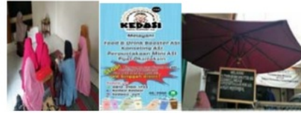
Gambar 9 Pelatihan Pemasaran