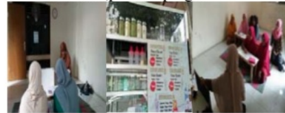
Gambar 10 Proses Evaluasi kegiatan dan hasil