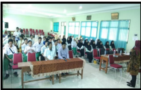
Gambar 3.1 Pelaksanaan Kegiatan Penyuluhan Kesehatan Reproduksi Remaja Santri Husada Pondok Pesantren Al Hikam Bangkalan

Kegiatan berikutnya adalah penyuluhan kesehatan reproduksi remaja, kegiatan ini berlangsung secara tertib dengan jumlah peserta sebanyak 50 orang yang berasal dari kader santri husada poskestren pondok pesantren Al Hikam Bangkalan. Kader santri husada poskestren pond 24 pesantren Al Hikam Bangkalan terdiri atas santri dengan rentang usia 12 – 18 Tahun. Kegiatan ini cukup mendapatkan perhatian dan antusias dari santri, hal ini terlihat dengan jumlah peserta dan keaktifan diskusi saat penyuluhan berlangsung.