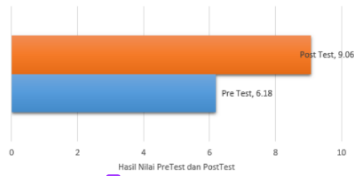
Gambar 3.1 Hasil Rerata Pre Test Dan Post Test

Sebelum dilakukan pemaparan materi dilakukan terlebih dahulu pre test dan setelah pemaparan materi, santri husada kemudian diberikan post-test . Kemudian analisis di 3 lakukan dengan menghitung jumlah benar dari soal pre test dan post 10 . Berikut merupakan hasil rerata jumlah benar soal dari pre-test dan post-test .