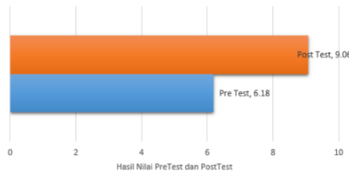
Gambar 3.1 Hasil Rerata Pre Test Dan Post Test

Sebelum dilakukan pemaparan materi dilakukan terlebih dahulu pre test dan setelah pemaparan materi, santri husada kemudian diberikan post-test . Kemudian analisis di 23 kan dengan menghitung jumlah benar dari soal pre test dan post test . Berikut merupakan hasil rerata jumlah benar soal dari pre-test dan post-test .