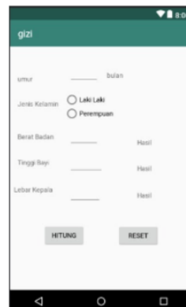
Gambar 4. Tampilan GUI aplikasi

hitung berfungsi untuk memulai proses pemeriksaan berdasarkan Standar Pengukuran Status Gizi Bayi dari Kementerian Kesehatan Republik Indonesia. Sedangkan tombol reset merupakan tombol untuk menghapus semua input yang dilakukan oleh pengguna sebelumnya sehingga memudahkan pengguna dalam melakukan pemeriksaan status gizi bayi berikutnya. Untuk output, aplikasi memanfaatkan fitur TextView dimana TextView akan berubah menjadi hasil pemeriksaan ketika tombol hitung ditekan.