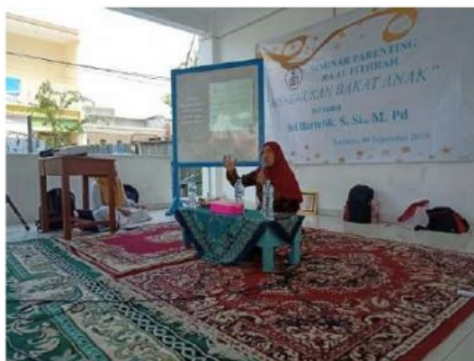
4 Gambar 1, pemaparan materi oleh narasumber

Kegiatan pengabdian masyarakat ini diawali dengan persiapan dimana nara sumber mempersiapkan materi dalam bentuk PPT, disaat pemateri menyiapkan materi, panitia menyiapkan instrumen pemahaman terkait menentukan bakat anak. Instrumen berisi 10 soal esai terkait menentukan bakat anak. Materi yang disusun pada PPT bersumber pada beberapa sumber artikel yaitu Akhirin, (2015), Atabik Ahmad (2018), Kartono, Kartini, (1995). Dan Nihayah, Ulin. (2015).