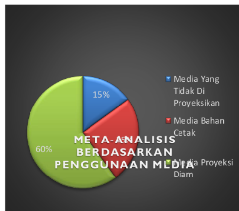
Gambar 1. Diagram Lingkaran Penggunaan Media

Bedasarkan klasifikasi yang sudah dilakukan, maka hasil persentase diagram lingkaran dari 20 penelitian adalah sebagai berikut: