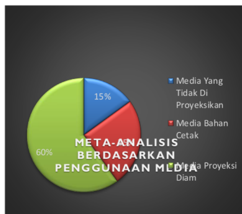
Gambar 1. Diagram Lingkaran Penggunaan Media

Bedasarkan klasifikasi yang sudah dilakukan, maka hasil persentase diagram lingkaran dari 20 penelitian adalah sebagai berikut: