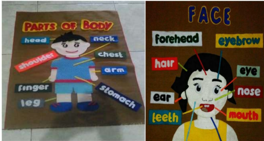
Gambar 1. Gambar Flanel

Pada gambar 1 ada beberapa kata bahasa Inggris yang berhubungan dengan bagian-bagian tubuh dan bagian-bagian wajah. Gambar flanel ini digantung di dinding kelas. Kata-kata bahasa Inggris flanel dapat diperkenalkan oleh guru pada siswa dengan menggunakan media ini. Untuk memainkan gambar flanel ini, guru harus mengenalkan kosakata bahasa Inggris yang terkait dengan bagian-bagian tubuh dan bagian-bagian wajah dengan makna bahasa Indonesia dan mengoreksi ejaan dan pengucapan. Selanjutnya, semua kata bahasa Inggris ditanyakan kembali pada siswa dan meminta siswa secara bergiliran untuk menaruh kata yang tepat pada gambar berdasarkan panah yang tertuju pada bagian tubuh dan bagian-bagian wajah pada gambar flanel tersebut. Dalam melakukan ini, para siswa melakukannya secara bergantian.