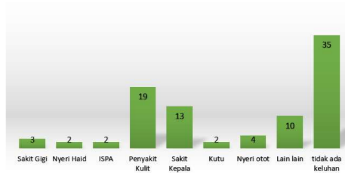
Gambar 3.5 Daftar Penyakit terbanyak yang sering diderita santri Pondok Pesantren Al Hikam Bangkalan

apapun. Hipertensi merupakan salah satu faktor resiko utama yang menyebabkan serangan jantung dan stroke, yang menyerang sebagian besar penduduk dunia. Hipertensi adalah suatu keadaan dimana dijumpai tekanan darah 140/90 mmHg atau lebih untuk usia 13 – 50 tahun dan tekanan darah mencapai 160/95 mmHg untuk usia di atas 50 tahun. Pengukuran tekanan darah setidaknya dilakukan minimal sebanyak dua kali untuk lebih memastikan keadaan tersebut (Saputra and Indrawanto, 2013).