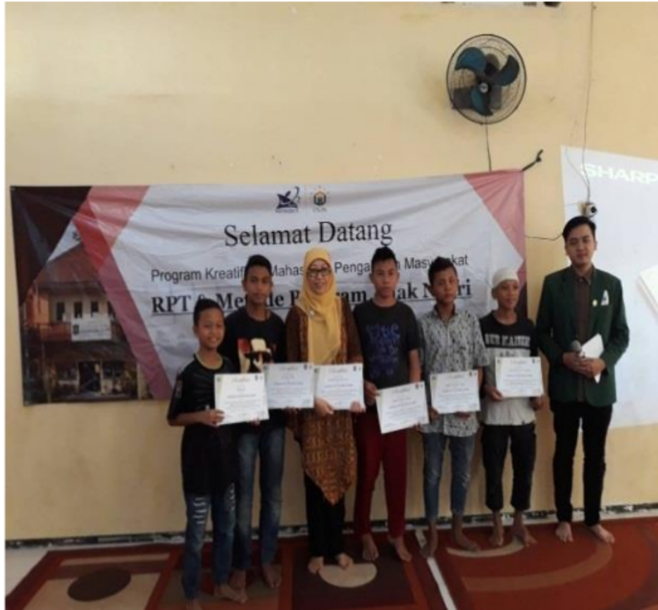
Gambar 5. Pembentukan Kader “Anak Negeri”