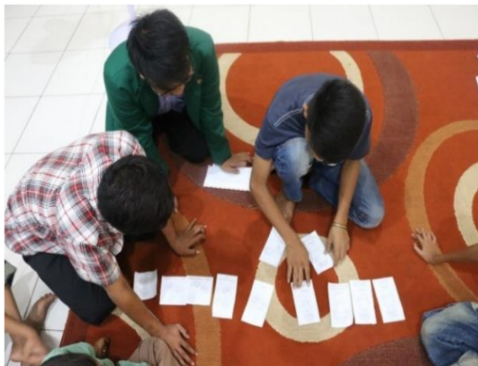
Gambar 4. Permainan Edukasi Bertema Spiritualitas