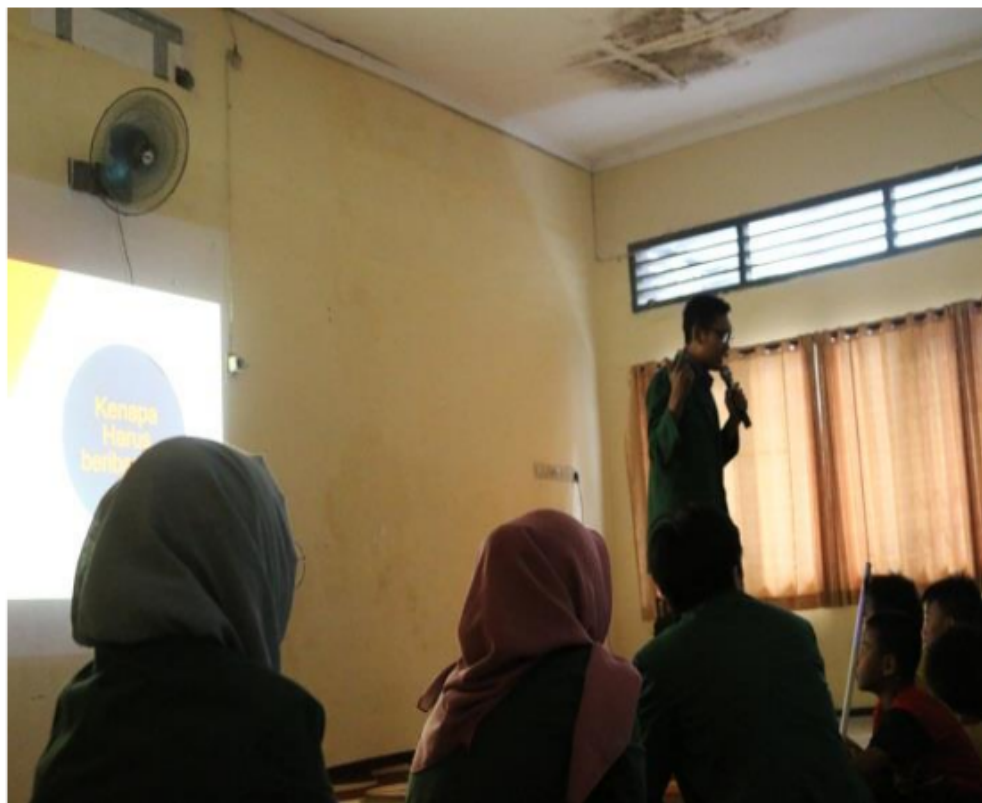
Gambar 3. Pembelajaran Anak Negeri Bertema Spiritualitas