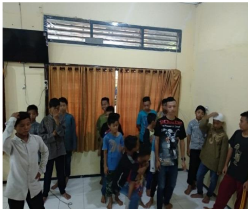
Gambar 2. Permainan Edukasi Bertema Nasionalisme