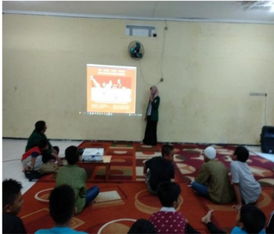
Gambar 1. Pembelajaran Anak Negeri Bertema Nasionalisme