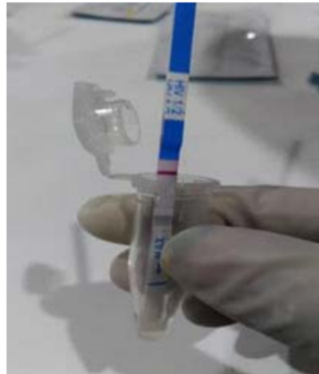
Gambar 1 Pengujian Serum pada Sampel Terhadap HIV dengan rapid test

Dari hasil penelitian yang dilakukan dengan menggunakan monotes rapid test HIV didapatkan hasil bahwa remaja dengan memiliki latar belakang pondok pesantren di Surabaya negatif terhadap HIV dengan menggunakan rapid test HIV monotes. Hasil pengujian dengan menggunakan rapid test sebagai berikut.