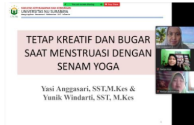
Gambar 1 Pelaksanaan Pemberian Materi Melalui zoom

Setelah selesai pengisian kuesioner pre-test, dilanjutkan dengan pemberian materi pendidikan kesehatan tentang nyeri haid dengan penanganan senam yoga. peserta tampak antusias dan menyimak penyuluhan saat pemateri menjelaskan tentang nyeri haid dan tindakan senam yoga yang perlu dilakukan.