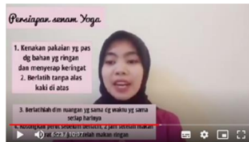
Gambar 2 Video Langkah- Langkah senam yoga

Kegiatan selanjutnya adalah dengan pemberian simulasi/pelatihan melalui video tutorial oleh tim pengabdian masyarakat kemudian dilakukan dengan simulasi oleh peserta dengan mengirim umpan balik berupa video tutorial senam yoga kedalam grup whatsapp. Hasil dari simulasi senam yoga yang telah diajarkan ini adalah peserta mampu mengulang kembali langkah-langkah senam yoga yang telah diberikan. Cara yang dilakukan peserta untuk mempermudah mengingat adalah dengan memberikan video berisi langkah-langkah senam yoga.