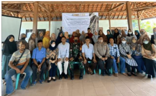
Gambar 2. Pembentukan kader kesehatan.

Kegiatan ini dilakukan pada hari Minggu, 31 Juli 2022 bertempat di Balai Desa Keleyah, Kec. Socah, Bangkalan, Madura. Pada kegiatan ini terbentuk kader untuk melaksanakan kegiatan pengabdian masyarakat sebanyak 20 orang ibu kader. Setelah kader terbentuk, maka kader dibagi menjadi 5 kelompok untuk mempermudah pembagian job desk pada saat kegiatan dan untuk melanjutkan kegiatan jangka Panjang.