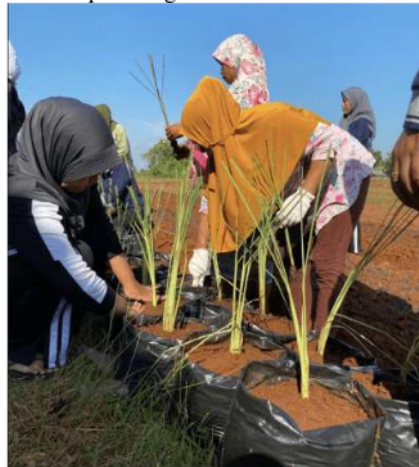
Gambar 5. Demonstrasi dan pendampingan penanaman tanaman herbal

Kegiatan ini dilakukan pada hari Kamis, 18 Agustus 2022 bertempat di lahan pertanian di belakang Balai Desa Keleyah, Kec. Socah, Bangkalan, Madura. Dalam kegiatan ini dilakukan penanaman di media masing-masing dengan jumlah 50 bibit per jenis tanaman. Para kader juga dibawakan bibit untuk dibagikan ke tetangga dan ditanam di pekarangan rumah.