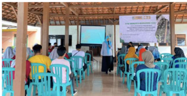
Gambar 3. Sosialisasi dan buku panduan

Kegiatan ini dilakukan pada hari Minggu, 07 Agustus 2022 bertempat di Balai Desa Keleyah, Kec. Socah, Bangkalan, Madura. Pada kegiatan ini diberikan beberapa materi antara lain: teknik konservasi tanaman, program budidaya konservasi tanaman, dan manfaat tanaman herbal dari sisi medis atau kesehatan. Pada kegiatan ini para kader juga diberikan Buku Panduan 1 tentang Teknik Konservasi Tanaman dan Buku Panduan 2 tentang Pengolahan Hasil Produk dan produksi Minuman Jamu.