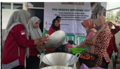
Gambar 7. Pengolahan hasil produksi minuman herbal.

Kegiatan ini dilakukan pada hari Sabtu, 01 Oktober 2022 bertempat di Balai Desa Keleyah, Kec. Socah, Bangkalan, Madura. Pada kegiatan ini produk yang dihasilkan antara lain jahe merah, kencur, kunyit dan temulawak.