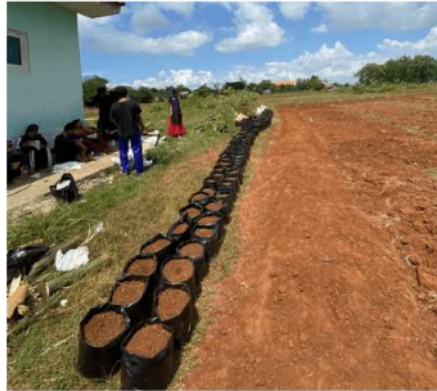
Gambar 4. Persiapan media tanaman

bedengan. Kegiatan yang dilakukan selanjutnya adalah mencampurkan pupuk kandang, sekam bakar, tanah yang kemudian akan dimasukkan ke dalam polybag. Untuk bedengan dibagi menjadi 3 (tiga) dengan jumlah 80 tanaman tiap tanamannya. 5 (lima) tanaman yang akan ditanam adalah jahe merah, kencur, temulawak, sirih dan kunyit.