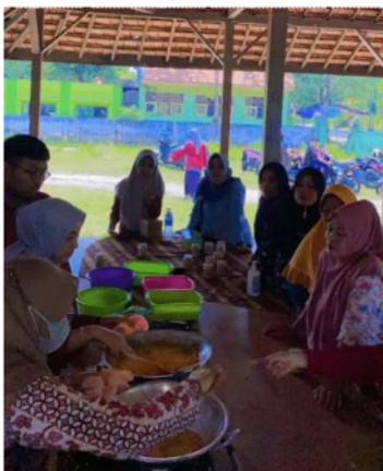
Gambar 6. Penyuluhan dan demonstrasi pengolahan hasil produksi

Kegiatan ini dilakukan pada hari Sabtu, 24 September 2022 bertempat di lahan pertanian di belakang Balai Desa Keleyah, Kec. Socah, Bangkalan, Madura. Kegiatan demonstrasi pengolahan hasil produksi ini dimulai dari membersihkan rimpang tanaman herbal, dikupas hingga bersih kemudian dihaluskan dan sarinya dimasak bersamaan dengan gula. Selanjutnya dimasak dalam waktu \pm 2 jam hingga mengkristal menjadi serbuk jamu.