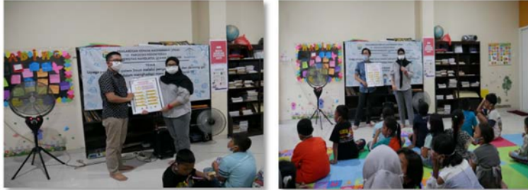
Gambar 4. Penyerahan poster Gambar 5. Pemberian penyuluhan 10 gizi seimbang

Berdasarkan Gambar 2 menunjukkan bahwa distribusi jenis kelamin peserta pengabdian kepada masyarakat sebagian besar adalah perempuan dengan persentase 58% dan laki-laki sebesar 42%