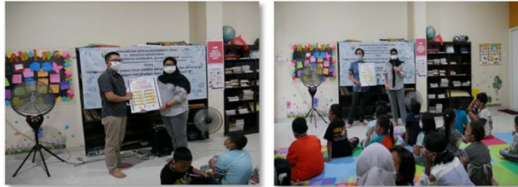
Gambar 4. Penyerahan poster Gambar 5. Pemberian penyuluhan 10 gizi seimbang

Berdasarkan Gambar 2 menunjukkan bahwa distribusi jenis kelamin peserta pengabdian kepada masyarakat sebagian besar adalah perempuan dengan persentase 58% dan laki-laki sebesar 42%