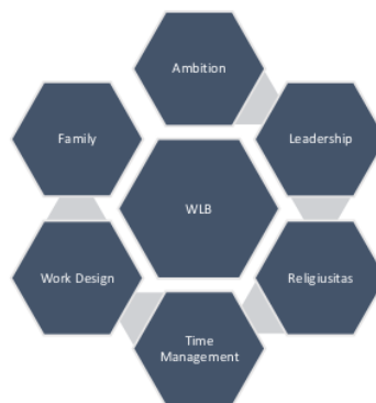
Hasil : formulasi analisis penelitian Gambar : 2

Sebagaimana Gambar 1, maka beberapa aspek yang berkaitan dengan Work Life Balance adalah :