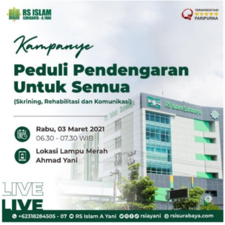
Gambar 1. Pengumuman Kampanye Peduli Pendengaran Untuk Semua di Media Sosial RS Islam Surabaya

pendengaran, macam - macam gangguan pendengaran. Bagaimana merawat telinga, jenis gangguan pendengaran pada telinga.