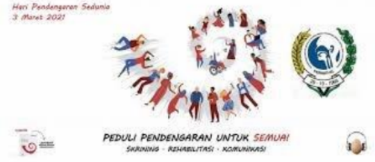
Gambar 4. Spanduk Yang Digunakan Dalam Kampanye Pendengaran Untuk Semua

Beberapa poster yang dibuat dimaksudkan untuk menumbuhkan kepedulian terhadap fungsi pendengaran antara lain adalah (1) poster yang menyajikan fakta 360 juta orang menderita gangguan pendengaran, (2) poster yang menunjukkan pemerintah Indonesia dalam keseriusannya mencegah ketulian yang diakibatkan kebisingan, (3) poster yang berisi bahwa beberapa fakta yang menyebabkan gangguan pendengaran diantaranya adalah penggunaan headset, (4) poster yang berisi untuk menjaga telinga supaya tetap sehat dan bersih