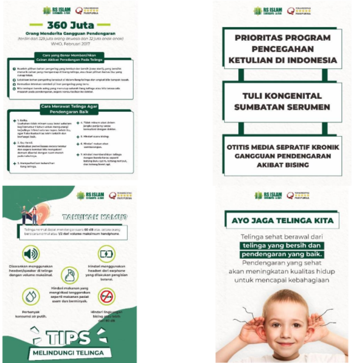
Gambar 4. Poster Kampanye Memperingati Hari Pendengaran Sedunia Untuk Aksi Turun Ke Jalan

Beberapa poster yang dibuat dimaksudkan untuk menumbuhkan kepedulian terhadap fungsi pendengaran antara lain adalah (1) poster yang menyajikan fakta 360 juta orang menderita gangguan pendengaran, (2) poster yang menunjukkan pemerintah Indonesia dalam keseriusannya mencegah ketulian yang diakibatkan kebisingan, (3) poster yang berisi bahwa beberapa fakta yang menyebabkan gangguan pendengaran diantaranya adalah penggunaan headset, (4) poster yang berisi untuk menjaga telinga supaya tetap sehat dan bersih