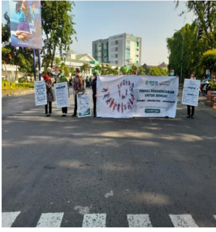
Gambar 2 Aksi Turun Kejalan dalam Rangka Kampanye Pendengaran Peduli Sesama