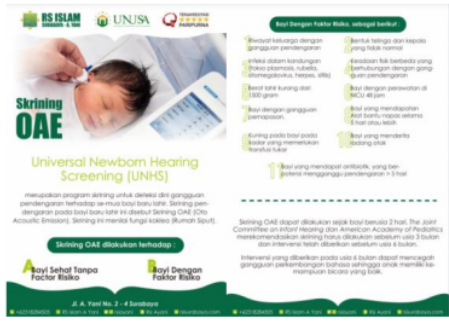
Gambar 3. leaflet Kampanye Memperingati Hari Pendengaran Sedunia Untuk Aksi Turun Ke Jalan

Poster, leaflet dan spanduk berisi himbuan agar masyarakat lebih peduli terhadap kesehatan telinga, terdapat 1 buah leaflet 4 poster dan 1 spanduk yang akan digunakan untuk aksi turun ke jalan .Leaflet yang berisi himbuan untuk mencegah gangguan pendengaran sejak dari usia bayi beberapa bayi yang memungkinkan untuk dilakukan untuk screening adalah (1) Bayi sehat tanpa factor resiko, (2) bayi dengan factor risiko.