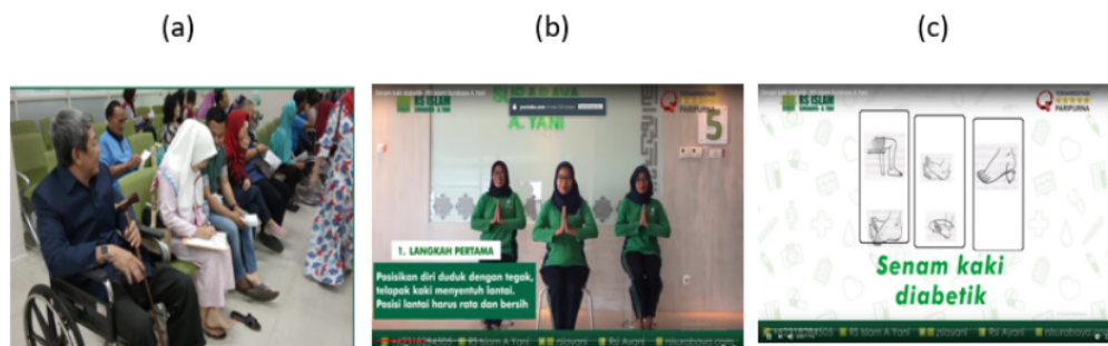
Figure 2. (a) Pelaksanaan Kelas Senam Diabetes, (b) Modul Video Senam Diabetes, (c) Brosur yang dibagikan kepada peserta

Berikut adalah manfaat Studi telah membuktikan bahwa senam kaki efektif untuk mencegah komplikasi kaki diabetes seperti gangguan pembuluh darah, luka terbuka yang sulit sembuh, serta masalah kaki lainnya. Berikut ini beberapa manfaat senam kaki pada diabetes (1) Memperbaiki sirkulasi darah yang terganggu, (2) Memperbaiki kekuatan otot tungkai dan kaki, (3) Melatih sendi agar tetap lentur dan tidak kaku, (4) Mencegah komplikasi diabetes pada organ seperti pada mata, otak, jantung dan ginjal. Selain bermanfaat, senam kaki sangat mudah dan praktis, sebab dapat dilakukan di mana saja, seperti di rumah atau di tempat kerja. Untuk melakukan senam kaki diabetes, dibutuhkan sebuah kursi dan selimbar kertas berukuran cukup besar, misalnya koran bekas.