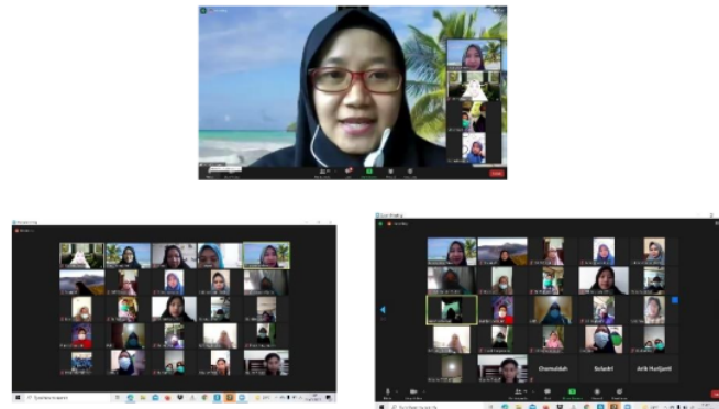
Gambar 2. Acara launching dan sosialisasi e-konseling

Dibawah ini gambar acara launching aplikasi media digital atau e-konseling