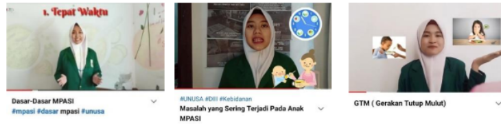
Gambar 1. Video edukasi

Tahap pelaksanaan dimulai dengan proses pembuatan dan editing video. Dibawah ini gambar video edukasi.