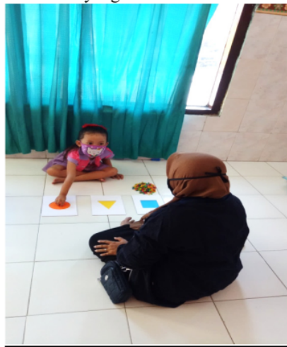
Gambar 3 Observasi Penelitian Media alam batu pelangi berbentuk geometri dan batu warna-warni yang bertemakan alam semesta

Berdasarkan data pada grafik diatas dapat dianalisa oleh peneliti, peningkatan kemampuan kognitif mengenal bentuk geometri dipengaruhi oleh media alam batu pelangi. Dengan media alam batu pelangi pembelajaran mengenal bentuk geometri lebih mudah dan menarik perhatian anak.