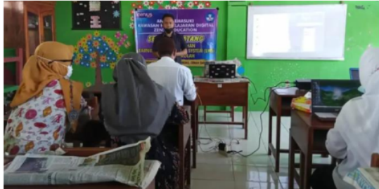
Gambar 2. Pemateri memberikan materi

Sebuah pemikiran terakhir dari presenter kami: pembelajaran yang benar bukanlah tentang memiliki teknologi atau perangkat lunak terbaik; ini tentang bagaimana menggunakan teknologi untuk membuat pembelajaran lebih menarik dan menantang bagi siswa.