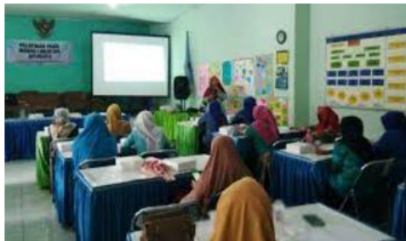
Gambar 1. Pemateri memberikan materi