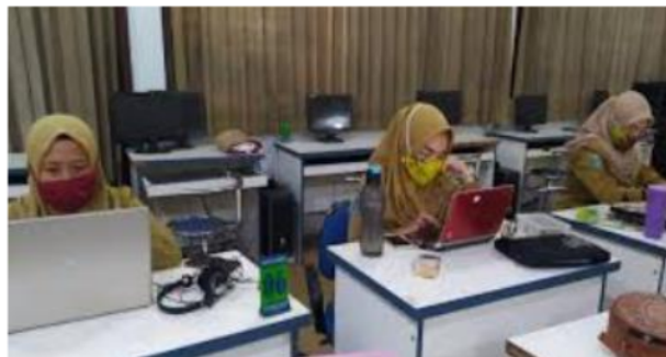
Gambar 5. Peserta Mengisi Survei

Setelah pelayanan selesai, pelayan mengevaluasi keberhasilan kegiatan. Hasil penilaian pemahaman konseptual dan penilaian keterampilan harus disajikan untuk melakukan analisis. Lihat grafik berikut untuk melihat seberapa baik guru secara umum memahami konsep-konsep kunci dalam tes yang mereka ambil: