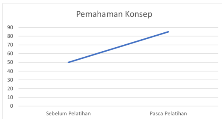
Gambar 6. Rata – rata hasil pemahaman konsep guru sekolah dasar

Grafik tersebut menunjukkan bahwa rata-rata kemampuan dan pengetahuan guru meningkat di atas 80 poin. Layanan ini menunjukkan bahwa guru SD mampu menyusun sumber daya online dengan benar dan efisien. Karena keterlibatan mereka dalam layanan, guru memastikan bahwa tujuan layanan terpenuhi. Keberhasilan pelatihan akan dipengaruhi oleh kinerja instruktur (Susanta et al., 2021; Yoshi, 2021).