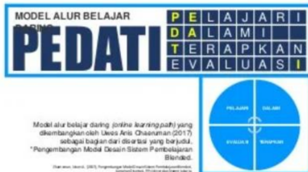
Gambar 3. Alur Belajar PEDATI