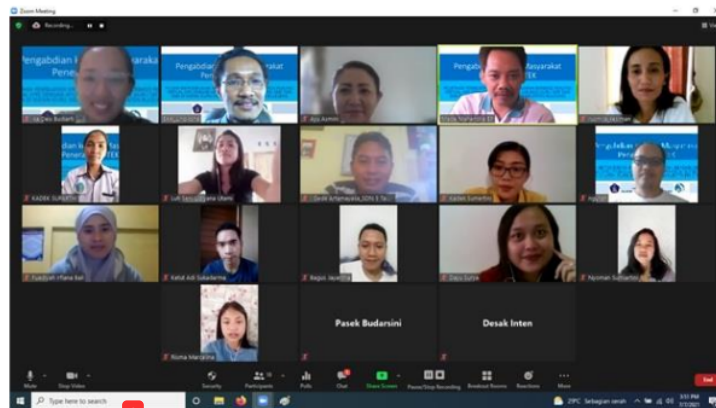
1 Gambar 3. Penyampain materi oleh tim pengabdian