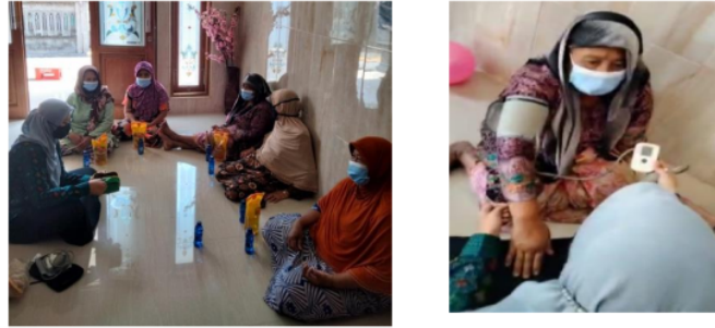
Gambar 2: Sosialisasi pentingnya olahraga bagi lansia di masa pandemi dan demonstrasi penggunaan tensimeter.

Kegiatan penyuluhan yang dilaksanakan tentang mengajarkan bagaimana peran Kader lansia dalam menjaga Kesehatan lansia selama pandemic COVID-19 memperoleh keberhasilan yang ditunjukkan dengan meningkatnya pengetahuan Kader lansia tentang materi yang disampaikan disesuaikan dengan kebutuhan sasaran sehingga pemberian edukasi tersampaikan dengan baik.