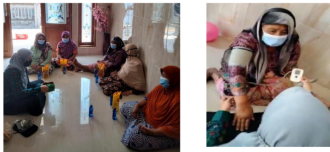
Gambar 2: Sosialisasi pentingnya olahraga bagi lansia di masa pandemi dan demonstrasi penggunaan tensimeter.

Kegiatan penyuluhan yang dilaksanakan tentang mengajarkan bagaimana peran Kader lansia dalam menjaga Kesehatan lansia selama pandemic COVID-19 memperoleh keberhasilan yang ditunjukkan dengan meningkatnya pengetahuan Kader lansia tentang materi yang disampaikan disesuaikan dengan kebutuhan sasaran sehingga pemberian edukasi tersampaikan dengan baik.