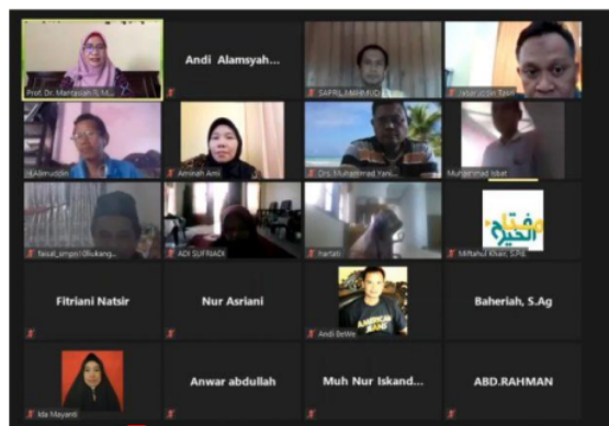
Gambar 2. Pelaksanaan Dampingan