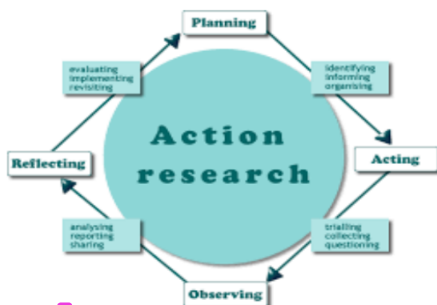
Gambar 1. Langkah Participatory Action Research

Kegiatan pengabdian akan diadakan secara online pada tanggal 7 Juni dan 8 Juni 2021 selama total dua hari. Metode penyampaian layanan ini adalah webinar atau seminar online. Topik pengabdian adalah guru bersertifikat Probolinggo Jawa Timur (dengan prioritas diberikan kepada guru kelas VI). Total ada 35 orang yang dibantu, 20 di antaranya adalah tenaga pendidik yang bekerja di SD dan 15 di antaranya bekerja di SMP. Pendekatan yang dikenal sebagai Participatory Action Research (PAR) diterapkan di sini. Pendekatan ini berbasis penelitian dan berbasis tindakan, memungkinkan peserta untuk membimbing, meningkatkan, dan mengevaluasi keputusan berdasarkan tindakan yang telah mereka buat (guru pendamping). Strategi disusun seperti sebuah siklus, dengan tahap perencanaan diutamakan, diikuti dengan tahap tindakan, kemudian tahap observasi, dan terakhir tahap refleksi (Setyaningsih & Asnawi, 2021).