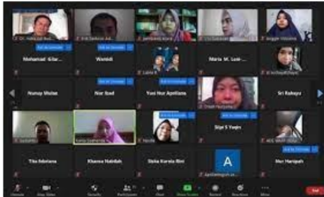
1 Gambar 1. Pemberian Ceramah melalui Presentasi Materi tentang Penelitian Tindakan Kelas