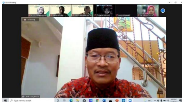
Gambar 3. Hasil Penelitian Tindakan

Hasil penelitian disebarluaskan saat kegiatan pendampingan selesai. Konferensi video digunakan untuk melakukan tugas ini. Instruktur kemudian menunjuk 1 pekerjaan yang telah disajikan oleh masing-masing guru. Rangkuman upaya kami dapat dilihat pada Gambar 3.