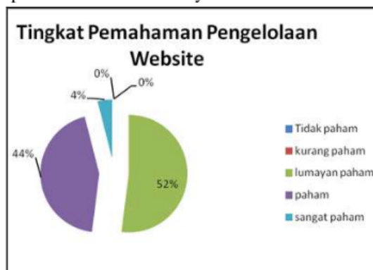
Gambar 5. Tingkat Pemahaman Setelah Pendampingan

Strategi awal dalam tahap memulai adopsi di MA Abadiyah adalah melakukan pendekatan komunikasi kepada agen perubahan mengenai pentingnya dan manfaat dari penggunaan teknologi informasi komunikasi yaitu website dan sistem keuangan. Agen perubahan yang dimaksud adalah kepala sekolah MA Abadiyah.