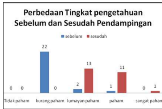
Gambar 6. Perubahan Tingkat Pemahaman

Berdasarkan Gambar 6, diketahui bahwa tingkat pengetahuan kurang paham yang awalnya sebanyak 22 orang (88 %) menurun menjadi 0 %. Hal ini berarti sudah tidak ada peserta yang kurang paham tentang keberadaan website. Sementara untuk tingkat pengetahuan lumayan paham yang awalnya hanya 2 orang (8 %) meningkat menjadi 13 orang (52 %). Begitu juga dengan tingkat pengetahuan paham meningkat dari 1 orang menjadi 11 orang. Tingkat pengetahuan terakhir, yakni sangat paham yang semula tidak ada juga sudah meningkat menjadi 1 orang. Artinya, secara keseluruhan terjadi peningkatan pemahaman dari peserta pendampingan. Selain itu, optimalisasi pengelolaan website dapat dilihat dari jumlah pengunjung dan update konten website. Jumlah pengunjung memperlihatkan bahwa informasi yang disajikan di dalam website sudah semakin banyak dilihat orang. Per tanggal 18 April 2019 pengunjung website sudah 900an. Kondisi ini meningkat 10 kali dari data per tanggal 20 Desember 2017. Data lain tentang update berita menunjukkan bahwa sebelum pendampingan informasi terakhir adalah awal bulan tahun 2018. Sedangkan setelah ada pendampingan update konten berita dilakukan hampir setiap hari.