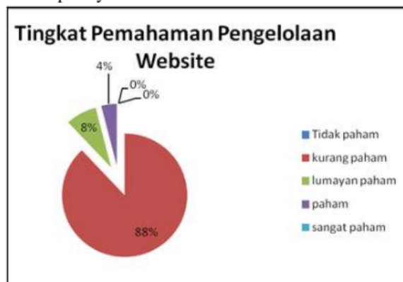
Gambar 4. Tingkat Pemahaman Sebelum Pendampingan

Melihat kondisi website yang belum terkelola dengan baik, sebelum pendampingan tim menggali informasi tentang tingkat pemahaman pengelolaan website. Wawancara yang dilakukan menunjukkan hasil tingkat pemahaman pengelolaan website seperti pada Gambar 4. Melalui Gambar 4 diketahui bahwa sebelum pendampingan sebagai peserta masih kurang paham tentang pengelolaan website, yakni sebesar 88 %. Hal ini berarti bahwa sebesar 88 % peserta hanya mengetahui tentang keberadaan website. Sedangkan untuk arti penting, cara, dan pengembangan pengelolaan website masih belum diketahui. Meskipun demikian, sudah ada peserta yang lumayan bahkan paham tentang pengelolaan website. Sebesar 8 % peserta lumayan paham (selain mengetahui keberadaan juga mengetahui arti penting pengelolaan website). Sementara itu, peserta yang sudah mengetahui cara mengelola website hanya sebesar 4 %. Berdasarkan informasi tersebut dapat disimpulkan bahwa masih belum ada peserta yang mengetahui tentang pengembangan website ke depannya.