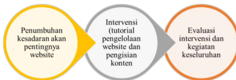
Gambar 1. Metode Pelaksanaan

Konsep kolaborasi antara tim pengabdian dan pihak madrasah digunakan sebagai metode dalam program pengabdian masyarakat ini. Metode ini dipilih untuk menumbuhkan jiwa mandiri dalam pemanfaatan teknologi informasi di lingkungan Madrasah Aliyah Abadiyah. Terkait dengan tujuan program yakni mengoptimalkan pemanfaatan website, mekanisme pengabdian terdiri dari 3 aktivitas besar seperti tersaji pada Gambar 1.