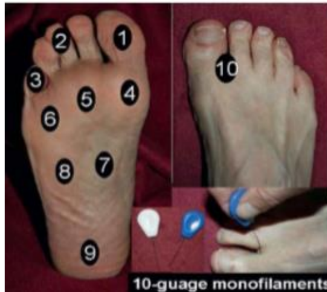
Gambar 3 Pemeriksaan 10 titik pada kaki