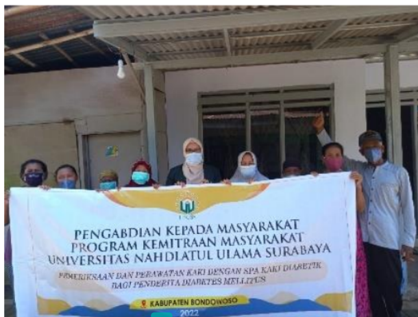
Gambar 1: Survei kelompok sasaran

Tim mendatangi lokasi pengabdian kepada masyarakat yang sudah memenuhi kriteria yaitu wilayah dengan kasus Diabetes Mellitus, kemudian melakukan wawancara dan observasi.