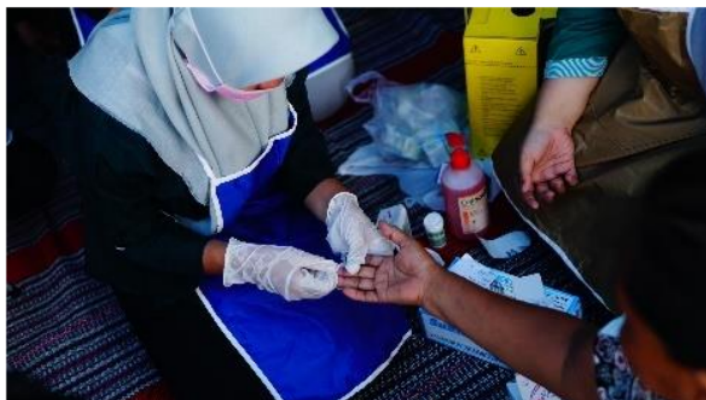
Gambar 2 Pemeriksaan gula darah

Program yang juga penting dalam pengabdian kepada masyarakat ini adalah pemberian edukasi tentang pemeriksaan kaki dan perawatan kaki. Kegiatan selanjutnya adalah melakukan pemeriksaan gula darah dan pemeriksaan kaki kemudian dilanjutkan dengan demonstrasi perawatan kaki dengan SPA kaki diabetik dan diakhiri dengan pemeriksaan gula darah kembali.