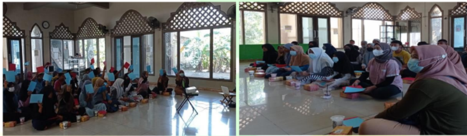
Gambar 2. Suasana Kegiatan Sesi Edukasi

3,3, sedangkan nilai rata-rata post-test adalah sebesar 6,3. Terdapat peningkatan sebesar tiga poin atau sebesar 90,9%, sehingga kegiatan pengabdian masyarakat ini dapat dinilai berhasil meningkatkan pengetahuan terkait gizi pada remaja, terutama mengenai Pedoman Gizi Seimbang, anemia, dan body image pada remaja. Peningkatan pengetahuan ini dapat tercapai karena edukasi menggunakan metode interaktif yang sesuai dengan karakteristik remaja (Lestari & Wulansari, 2018). Metode interaktif tersebut dapat membuat peserta merasa enjoy , antusias dan lebih memahami informasi yang diberikan oleh pemateri. Dengan adanya pemberian informasi terkait gizi pada remaja ini, peserta diharapkan dapat lebih mengetahui dan peduli terhadap diri sendiri serta makanan atau minuman yang dikonsumsi sehingga kejadian anemia serta body image negatif dapat dicegah.