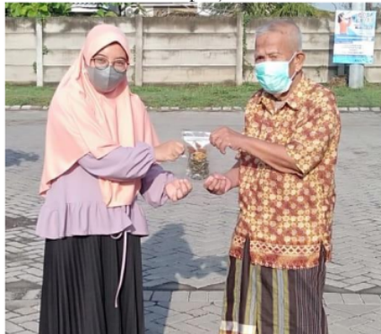
Gambar 3: Pemberian sampel jamu saintifik

dari 40% menjadi 95% seperti pada gambar 2. Berdasarkan banyaknya pertanyaan yang diutarakan saat acara seminar dan pelatihan menunjukkan antusiasme warga sangat tinggi terhadap kegiatan ini.